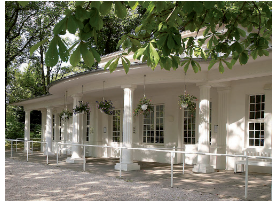
Außenansicht Alte Waage

Telefon 0211-5455580 E-Mail info@zack-bumm.net Website www.zack-bumm.net